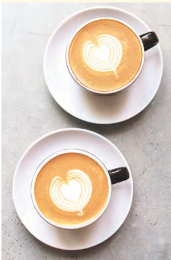
Кофе в помощь Напиток позволяет снизить риск смерти

Регулярное употребление кофе, даже в небольших количествах, снижает риск ранней смерти, особенно для переживших сердечный приступ, передаёт Business Insider со ссылкой на университеты Осаки, Цукубы и Хоккайдо. Недавно был проведён подробный анализ данных более 46 тыс. взрослых японцев. Учёные-эксперты фиксировали потребление чая и кофе, а также общее состояние здоровья и факты смерти. Оказалось, риск смерти по любой причине у тех,