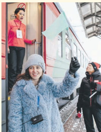
Тур с перспективой Компании организуют экскурсионные железно- дорожные маршруты

Совместно с министерством культуры Красноярского края был организован ознакомительный тур с приглашением региональных туроператоров. В мероприятии приняли участие представители железной дороги, министерств культуры края и Хакасии, гостиничного бизнеса, музеев, туристических информационных центров и операторов.